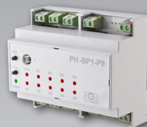
PH-BP1-P9 (receptor cu nouă canale)