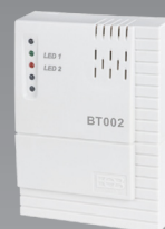
BT002 (montare pe perete)