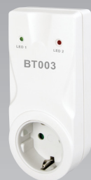
BT003 (montare în priză)