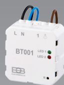
BT001 (montare sub tencuială)