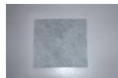
PRIMUS BANDĂ ETANȘARE ARMARE (BHF82) 400 x 400