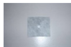
PRIMUS BANDĂ ETANȘARE ARMARE (BHF82) 120 x 120

Super-elastice Impermeabile Ușor de aplicat/montat Rezistente în mediu alcalin