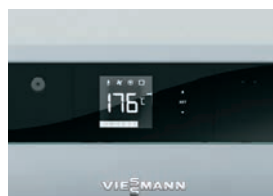
Automatizare Ecotronic 100 intuitivă cu ecran iluminat

Vitoligno 100-S este un cazan pe lemn cu gazeificare, compact și la un preț atractiv, adecvat atât pentru o funcționare în regim monovalent cât și în regim bivalent (în completarea unei instalații termice pe gaz sau combustibil lichid)