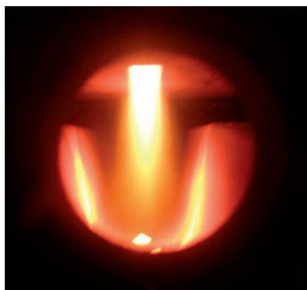
Tehnica de ardere prin gazeificare la Vitoligno 100-S

Aprinderea este accelerată cu ajutorul unei clapete care închide canalul colector al gazelor arse în faza de inițializare a arderii, crescând astfel depresiunea în cazan. La închiderea ușii cazanului, canalul colector al gazelor se deschide.